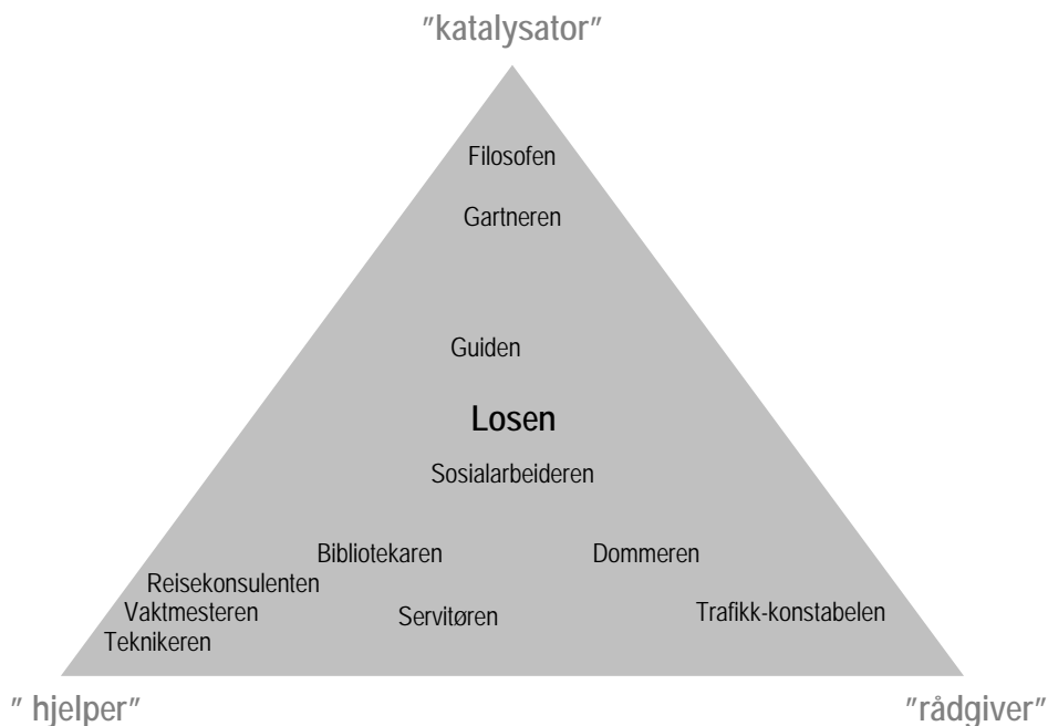
Figur 1: Læreres veilederroller i prosjektarbeid

Rollene representerer altså ikke roller lærerne bokstavelig talt gir uttrykk for å ha, men er konstruert ut fra fellestrekk ved lærernes beskrivelser av egne roller. Disse rollene lar seg videre plassere i forhold til hovedbegrepene lærerne identifiserte seg med: ”hjelper”, ”katalysator” og ”rådgiver”, gjennom følgende modell: